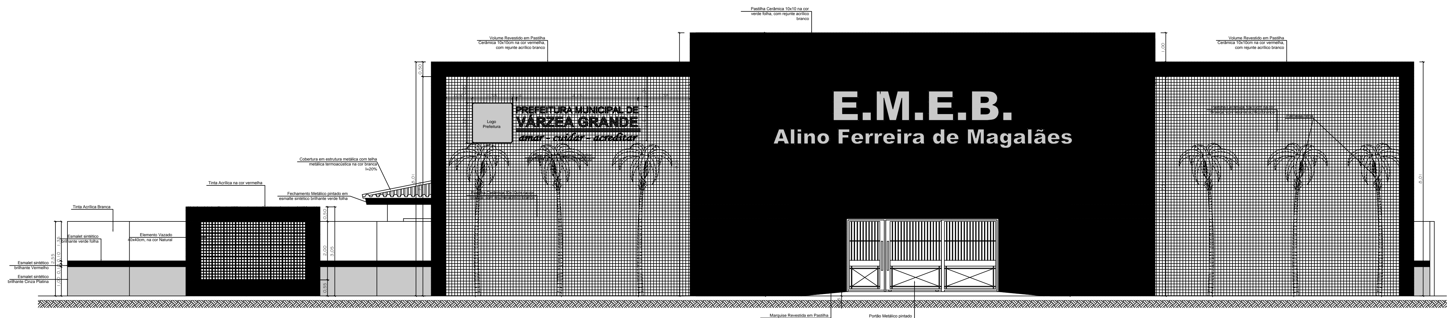
02 ELEVÇÃO A ESC. 1/75